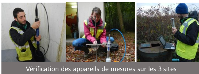
Vérification des appareils de mesures sur les 3 sites

Suite à l'identification de ces périodes clés, les conséquences de ces infiltrations sont analysées plus finement notamment en termes de transfert de nitrates et de produits phytosanitaires. D'une durée de 2 ans, ce suivi s'appuie sur un dispositif renforcé (mesures de nitrates, déplacement d'une sonde, ...) afin de répondre au mieux à cette problématique.